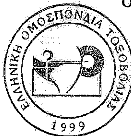
Δρ. Πέτρος Συναδινός